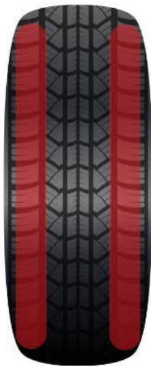
Schulterverschleiß: Durch falscher Achseinstellung oder zu niedrigen Reifendruck