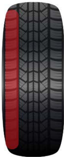
Durch falsche Achseinstellung oder positivem Radsturz nur außen abgefahrener Reifen