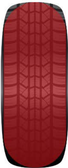
Normalverschleiß: Das Reifenprofil ist gleichmäßig abgenutzt.