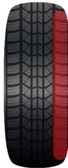
Durch falsche Achseinstellung oder negativem Radsturz nur innen abgefahrener Reifen