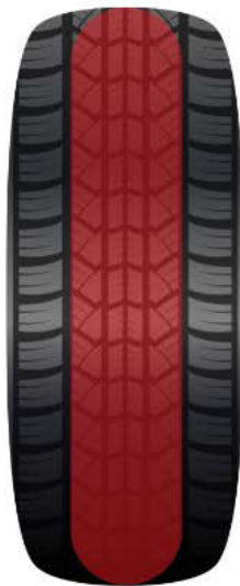
Zu hoher Reifendruck: Das Reifenprofil ist zentral abgenutzt