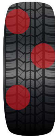
Lokaler Verschleiß: entsteht durch häufiges starkes Bremsen oder flascher Auswuchtung